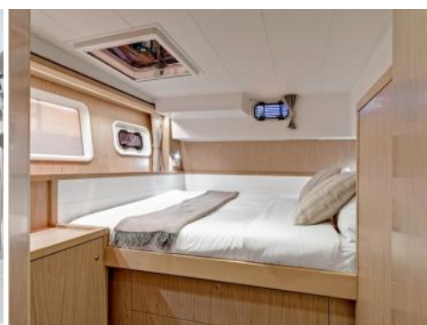
une cabine arriere